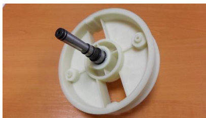
B – Short axle – 25316800103